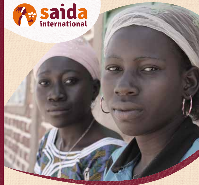
Gestaltung: die superpixel